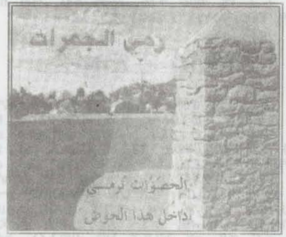
ረሚ ጀመራት እትድርቡሉ ቦታ ዘርኢ ስእሊ