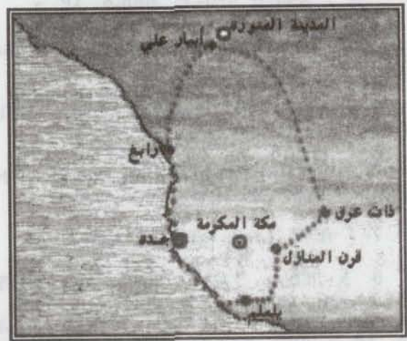
ኢሕራም (ሚቻት) ዝግበርሉም ቦታታት ዘርኢ ስኢሊ

عَنْ ابْنِ عَبَّاسٍ قَالَ إِنَّ النَّبِيَّ صَلَّى اللَّهُ عَلَيْهِ وَسَلَّمَ وَقَفَتْ لِأَهْلِ الْمَدِينَةِ ذَا الْحُلَيْفَةِ وَلِأَهْلِ الشَّامِ الْجُحْفَةَ وَلِأَهْلِ نَجْدٍ قَرْنَ الْمَنَازِلِ وَلِأَهْلِ الْيَمَنِ يَلْمَلَمَ هُنَّ لَهُنَّ وَلِمَنْ أَتَى عَلَيْهِنَّ مِنْ غَيْرِهِنَّ مَنْ أَرَادَ الْحَجَّ وَالْعُمْرَةَ وَمَنْ كَانَ دُونَ ذَلِكَ فَمَنْ حَيْثُ أَنْشَأَ حَتَّى أَهْلُ مَكَّةَ مِنْ مَكَّةَ * رواه البخاري